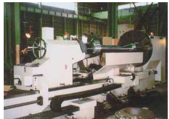
NC旋盤 NC Lathe