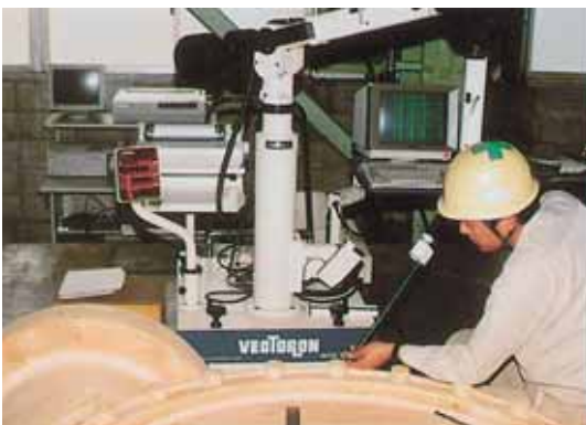
3次元空間座標測定器 Vectoron