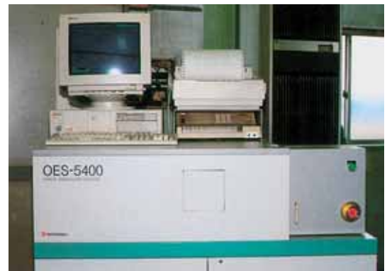
カントレコーダー Vacuum Quantorecorder