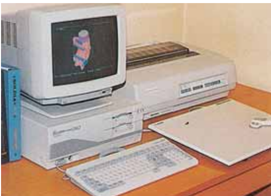
3次元凝固解析システム Solidification Analysis System