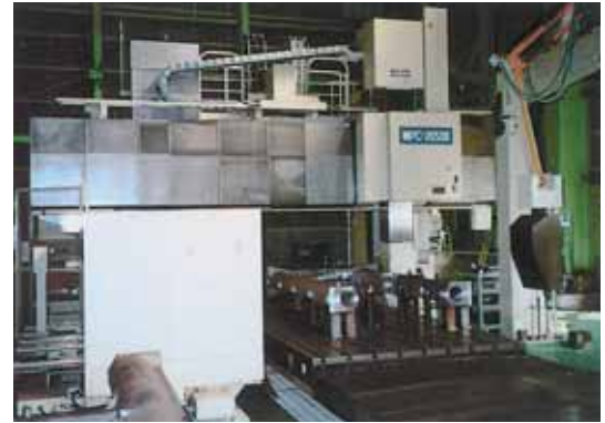
五面加工機 Machining Center