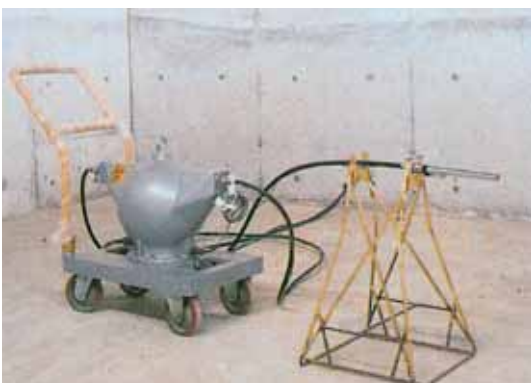
γ線検査装置 γ-Ray Inspection Apparatus